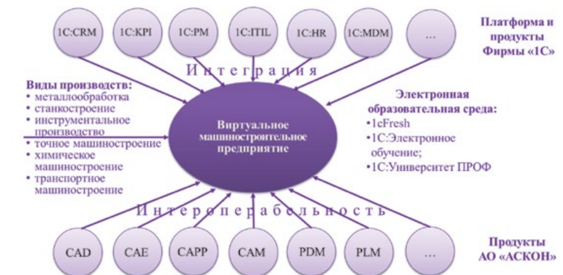
Концептуальная модель виртуального машиностроительного предприятия